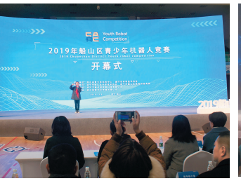
参赛学生代表宣誓