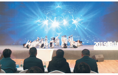
顺南街小学孩子表演《人机共舞》