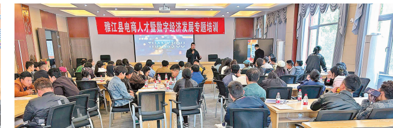
签约导师开展电商人才暨数字经济专题培训。