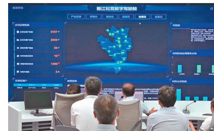
工作人员查看“雅江松茸产业大脑”。