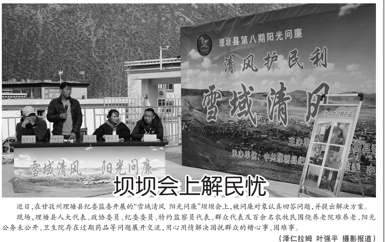
近日，在甘孜州理塘县纪委监委开展的“雪域清风 阳光问廉”坝坝会上，被问廉对象认真回答问题，并提出解决方案。现场，理塘县人大代表、政协委员、纪委委员、特约监察员代表、群众代表及百余名农牧民围绕养老院难养老、阳光公务未公开、卫生院存在过期药品等问题展开交流，用心用情解决困扰群众的糟心事、困难事。