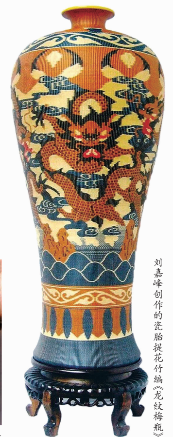
刘嘉峰创作的瓷胎提花竹编《龙纹梅瓶》