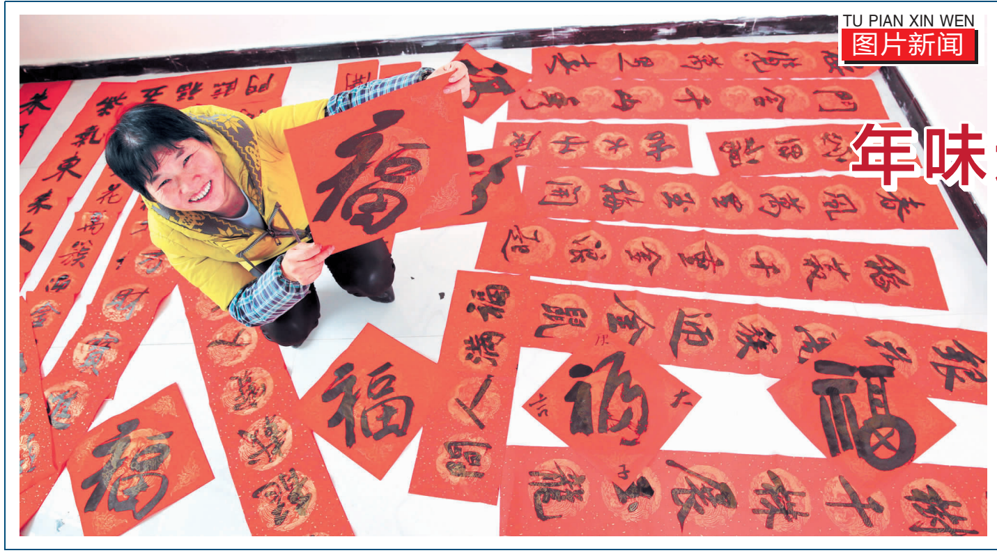
TU PIAN XIN WEN 图片新闻