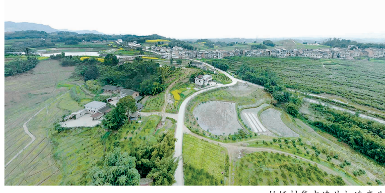
柏坪村集中连片打造产业

在“两项改革”中,原柏坪村、鱼龙村、龙柱村、仁和村四个村合并成柏坪村。合并后,柏坪村充分发挥地