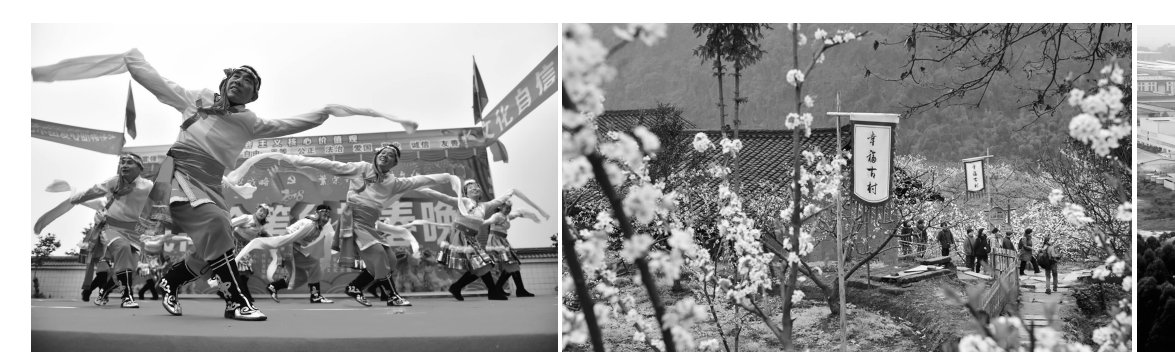
实施“幸福满城行动”,打造幸福乐园

报告强调,全县要坚持“开放引领”“绿色发展”“共建共享”三大发展理念,精准实施“六大行动”,全力打造“魅力六城”。要围绕成都建设国家中心城市、眉山建设“环成都经济圈开放发展示范区”,实施北融成都、西联雅安、东进东坡、南拓乐山“四向拓展”,深度融入眉山与天府机场、双流机场连接网,构建一小时临空经济圈,创建中国(四川)自由贸易试验区眉山协同改革先行区的重要基地、成眉同城(丹蒲)边界试验区和眉山—洪雅—雅安经济走廊。