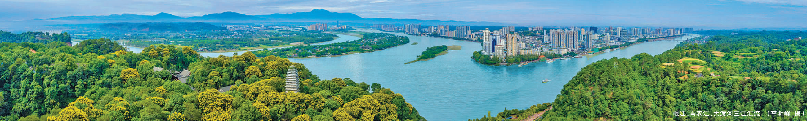
岷江、青衣江、大渡河三江汇流。

工业是实体经济的主体,是推动经济高速增长的基石。工业稳则经济稳,工业兴则经济兴。2023年以来,乐山市市中区在市委、市政府的坚强领导下,全区上下紧抓制造业发展核心,围绕重大产业项目,坚持稳中求进工作总基调,紧扣高质量发展主旋律,因势而谋、借势而进、乘势而上,全力以赴拼经济搞建设,奋力书写了全区工业高质量发展的崭新篇章。