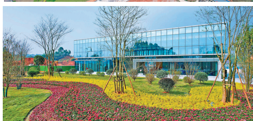
乐山味道川菜预制菜园。