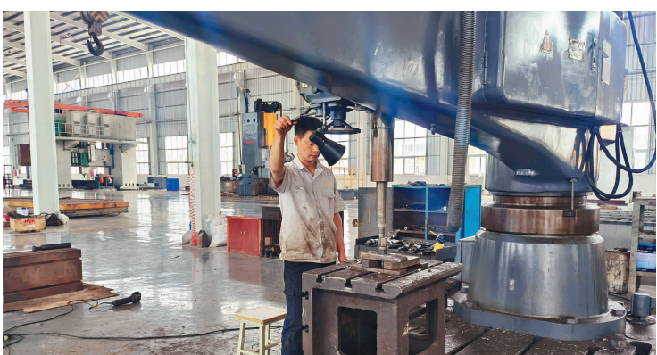
高端智能装备制造产业园。