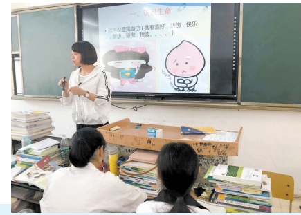
举行心理教育主题班会