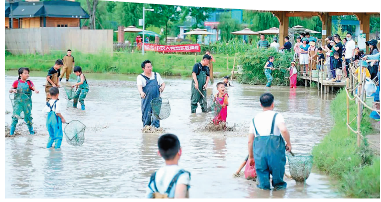
游客在池塘里网鱼。