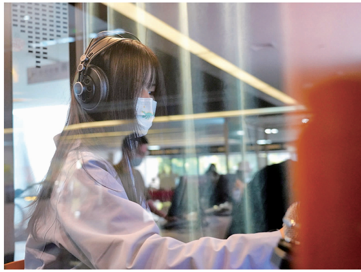
探班员体验朗读亭

四川省图书馆内每一层的借阅区大厅两侧都设有目录检索区,读者可以通过在电子检索设备上输入内容来迅速精准定位目