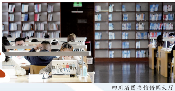
四川省图书馆借阅大厅