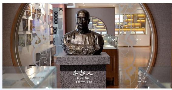
“李一氓李劫人文库”文献馆