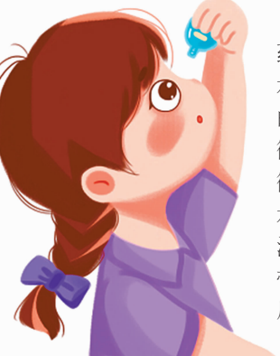
本版图片来自网络，请图片作者与本报联系，以付稿酬。

公告 2024年1月9日，我局执法人员接群众举报，联合彭州市公安局民警，在四川省成都市彭州市濛阳街道成德大道倒石桥旁100米处一辆重型自卸式货车(车牌号川AQ6350)车厢中，现场查获用绿色编织袋及灰白色编织袋包装的烟草专卖品：“国产卷型雪茄烟80支装”1100条、“国产卷型雪茄烟100支装”1480条、“国产卷型雪茄烟200支装”540条等，共5个品牌，4480条雪茄烟，并依法予以先行登记保存。 请托运人于本公告发布之日起60日内到我局接受调查处理。逾期不到，我局将依法对涉案烟草专卖品作出处理。 电话：028-83702564 地址：彭州市天彭镇天府中路260号 彭州市烟草专卖局 二〇二四年三月八日