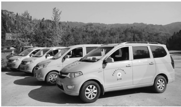
“金通工程”乡村客运专车

补贴;让乡村客运“开得通、留得住、通得好”。与此同时,丹棱县以乡村客运班线、城乡公交、便民小客运等方式进行交通全覆盖,群众可以根据自身实际情况订制私人赶场车、学生车、就医车、务工车、乡村旅游包车等,有效实现乡镇和建制村通客车率100%。