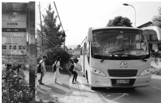
长流村学生乘公交车上学

作为全省首批乡村运输“金通工程”样板县,丹棱县在农村公路运输方面探索出哪些宝贵经验?群众从“金通工程”中获得了怎样的实惠?近日,记者一行来到丹棱县一探究竟。