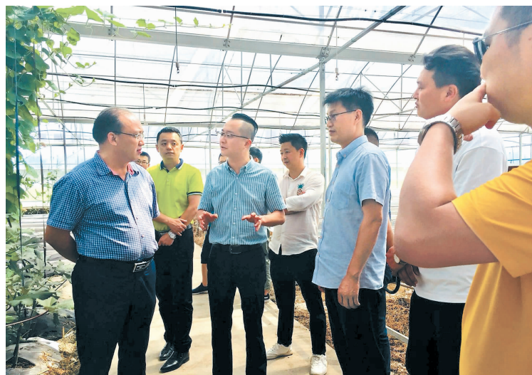
介绍蔬菜产业发展情况

峰立即进行实地考察。他发现，该园区地处平坦、土壤肥沃、基础设施完善，交通运输条件好，打造的标准也高，还有相关项目资金支持。“创业环境如此之好，机遇难