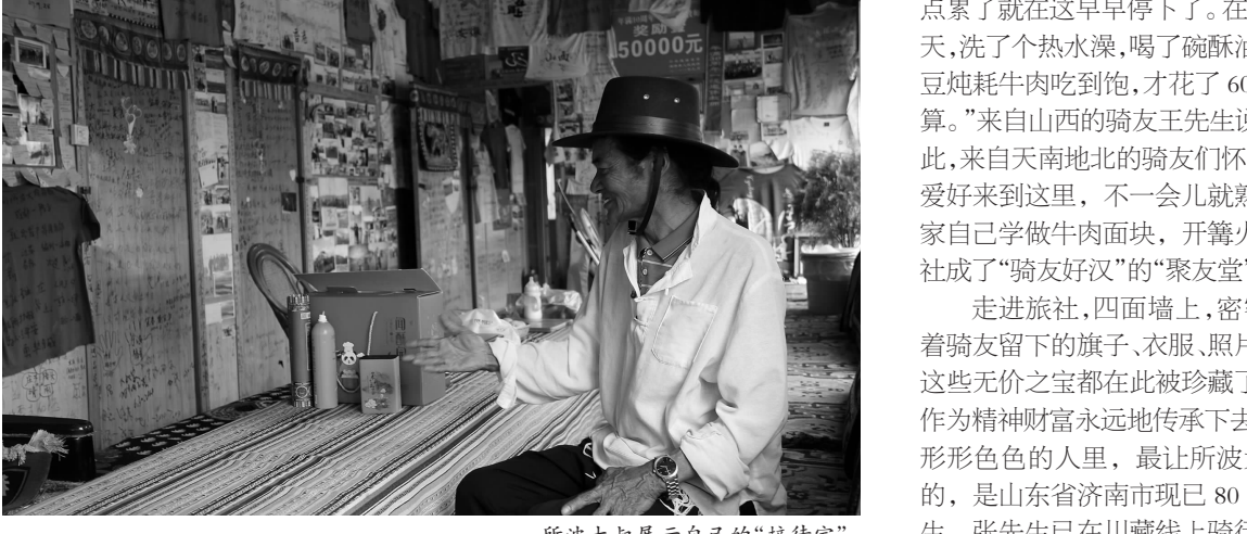
所波大叔展示自己的“接待室”。

据了解,所波大叔是在2011年决定修建旅社的,当时川藏南线还是土路,就已经有很多人在这条路线上骑行,看到行至此处的骑手们四处找牧民家借宿时,这个在乡村教了36年书、刚退休在家的康巴汉子闲不住了,习惯了“闹热”的他,在当地改变“逐水草而居”修建定居房时,就动员儿子多修建几间房间,好让骑手们有个“落脚地”。