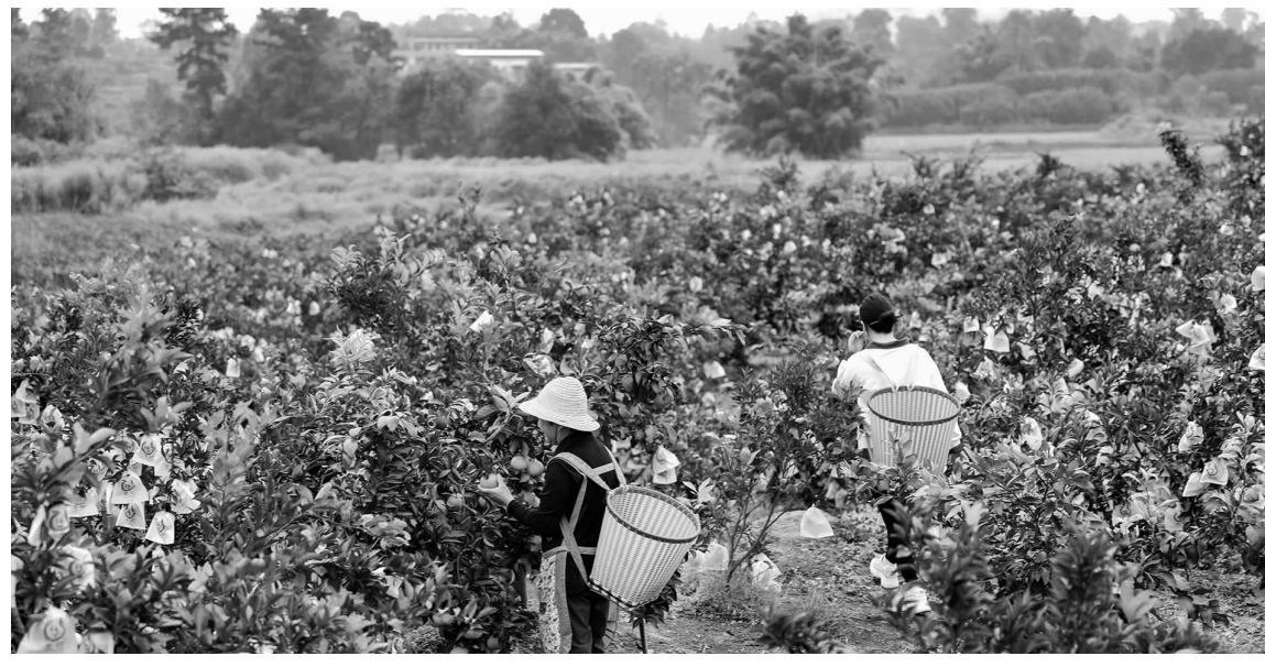
所波大叔展示自己的“接待室”。

日前,泸州市泸县玄滩镇易湾村理想家庭农场200余亩柑橘陆续迎来丰收,吸引了周边游客纷纷前来采摘。大家穿梭于田野间,品水果美味、赏田园美景、享丰收喜悦。