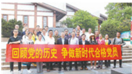
简阳职高开展主题党日活动

“欲穷千里目,更上一层楼。”“学校将围绕成都天府国际机场和临空经济区规划建设,汇聚政府、企业、高校、社会等各方资源,对应产业建设专业群,办适合社会需要、企业需要、企业需要、教师需要、学生需要的职业教育,以“西部一流、全国知名”为奋斗目标,借成都“东进”之势,简阳职高发展之势,建设临空空港地产业特色,服务临空经济区产业发展的技能型人才培养基地。”汪在文信心满满地说。