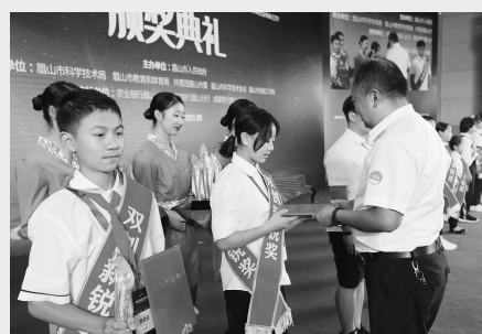
为获奖者颁发证书

本报讯 9月6日下午,由眉山市人民政府主办,市科技局、市教体局、共青团眉山市委、市科协、市金融工作局承办的眉山市首届「眉州之星」创新创业大赛颁奖典礼在眉山东湖饭店举行,现场为66个获奖优秀项目颁奖。