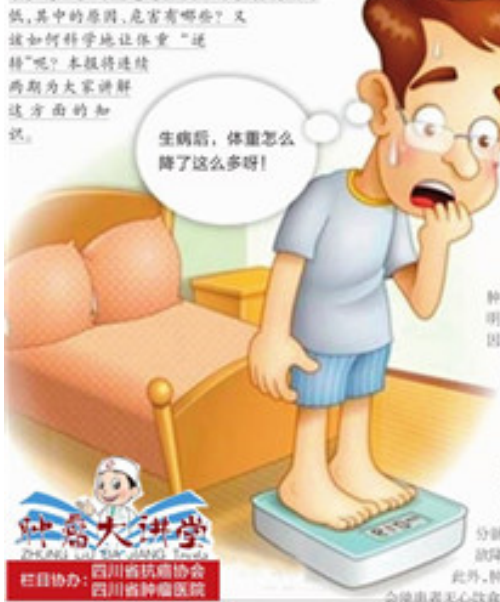
生病后,体重怎么降了这么多呀!

病房内宛如两个不同的世界。病房外,不少人追求着顿悟,A4腿和马甲线;而在病房里,大家渴望的唯有健康!有不少肿瘤患者生后体重会明显降低,其中的原因,危害有哪些?又该如何科学地让体重“逆转”呢?本报特邀西药师为大家讲解这方面的知识。