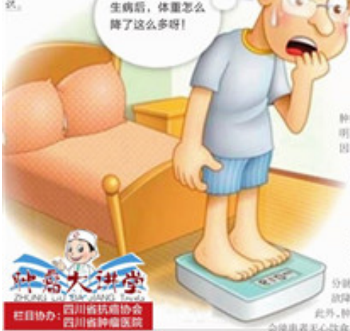
生病后，体重怎么降了这么多呀！

病房内宛如两个不同的世界。病房外，不少人追求着顿顿，A4腿和马甲线；而在病房里，大家渴望的唯有健康！有不少肿瘤患者生后体重会明显降低，其中的原因，危害有哪些？又该如何科学地让体重“逆转”呢？本报特邀西药师为大家讲解这方面的知识。