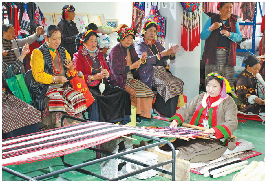
村仁拉粗制作绣品。