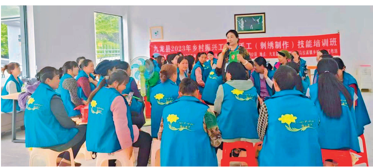
“绣娘”接受技能培训。