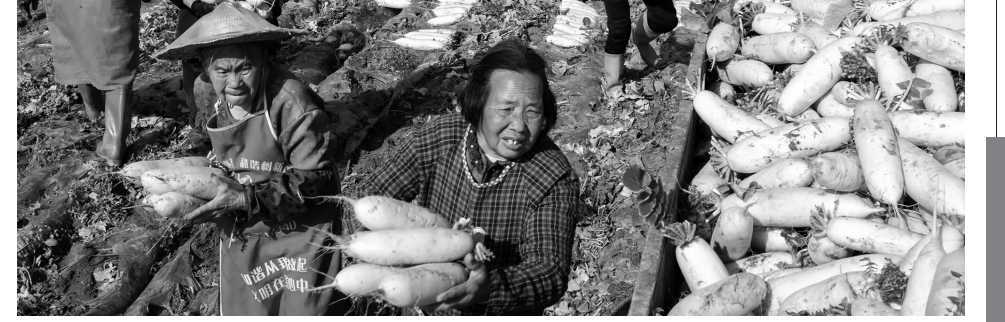
连日来,广安市武胜县礼安镇充分利用境内嘉陵江畔的滩涂发展萝卜种植,产品不仅销往国内广东、广西、山东、河北、重庆等地,近两年还销往俄罗斯等国家和地区,既盘活了滩涂,又增加了收入。图为 2 月 21 日,礼安镇杨家岩的村民在滩涂上收割销往俄罗斯等国家和地区的沙地萝卜。