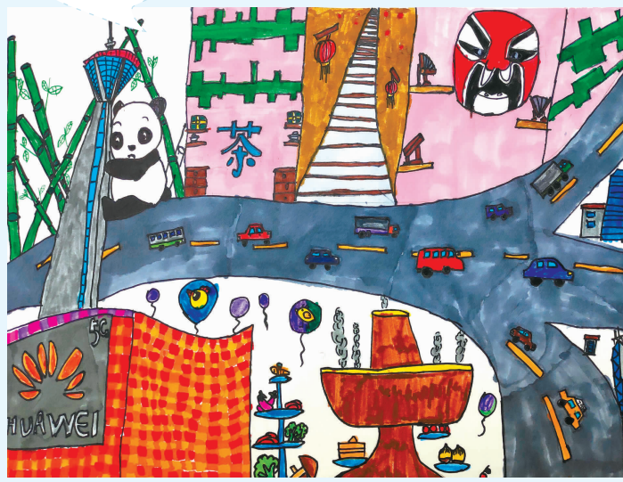
(该作品获“我看祖国的发展”征稿活动三等奖)