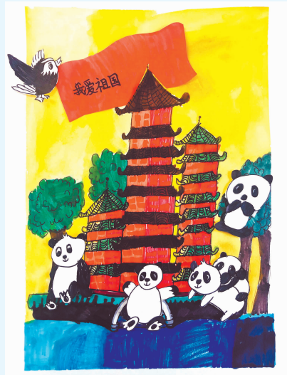
(该作品获“我看祖国的发展”征稿活动二等奖)