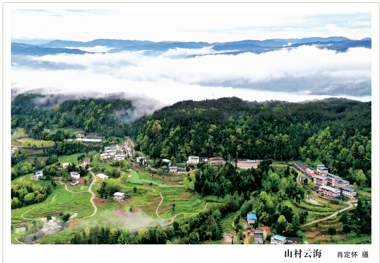
山村云海

时光荏苒,世事变迁。我坐月子的時候,每次看到碗里热气腾腾的红糖水泼鸡蛋,总是想到娘,想到娘当年对鸡蛋的无声渴望。于是,我买了几个鸡娃养着,鸡娃长大了下蛋,我把鸡蛋积攒起来。每次去看娘,必须带上几个鸡蛋。尤其是我过生日,会带上更多的鸡蛋,看着娘吃鸡蛋时,脸上盛开幸福的微笑。