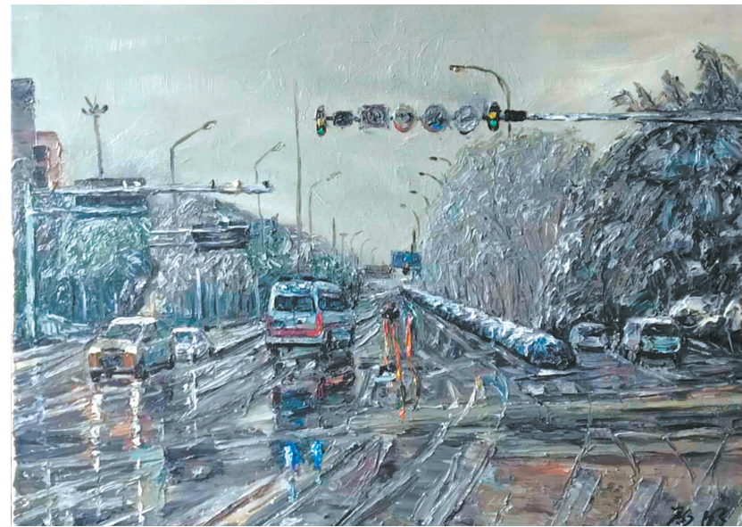
油画《使命》 作者:刘启明

现在,当我写下这段文字时,我也在感慨,感慨在这场突如其来扰乱我们生活的疫情面前,我们能看见许多,也能感受到许多,往常平静的生活中看不到的人和事。在如今中国的和平年代,有这么多既可贵又可爱的人,我们没理由击败不了这场疫情,我们一定可以取得最终的胜利!