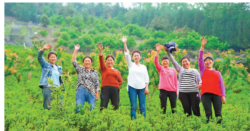
合作社成员在红豆杉林里合影留念。