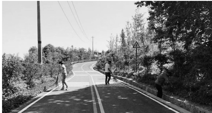
村民开展环境卫生整治

为切实解决群众困扰,还村民一个整洁干净美丽的村庄,2018年起,高宝村推行垃圾分类“高岗模