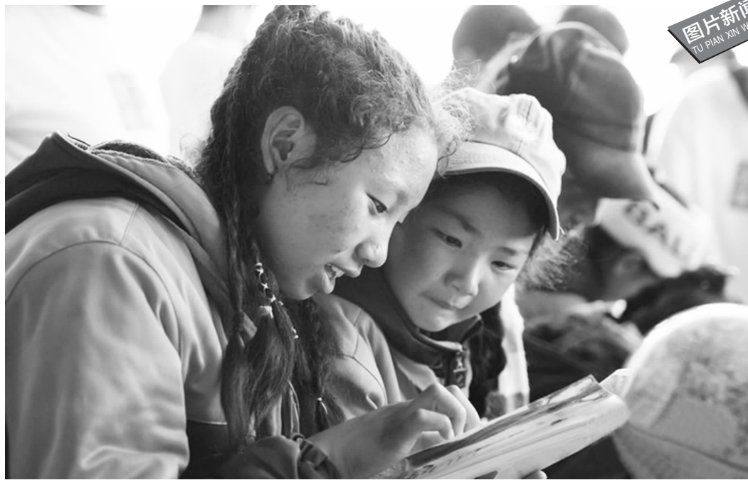
图片新闻 TU PIAN XIN WEN