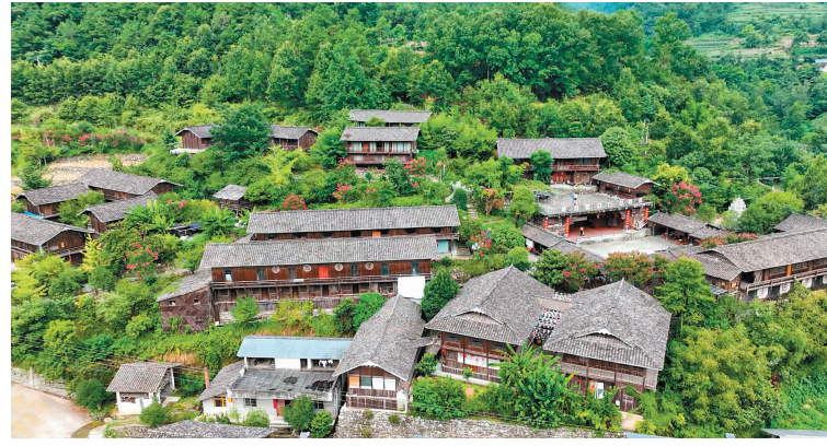
羌绣培训展教基地。