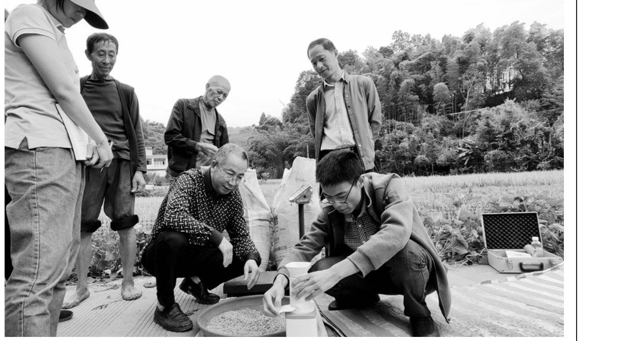
近日,宜宾市长宁县各乡镇再生稻喜获丰收,县农业农村局邀请市农业农村局、市农科院水稻测产专家到梅白镇洪漠园、铜鼓镇龙舞村,对再生稻进行现场测产,测产稻田再生稻平均产量为325.4公斤/亩,托起了村民丰产增收新希望。图为测产现场。