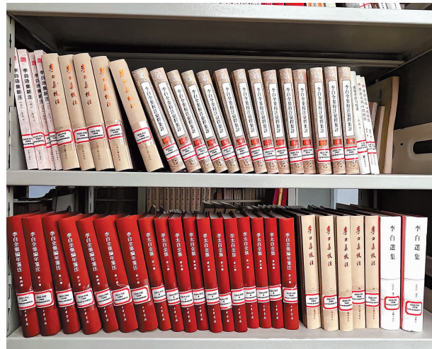
李白文化研究专著