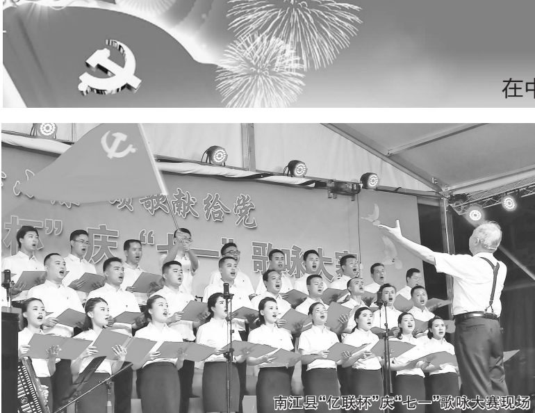
南江县“忆峥嵘”庆“七一”歌咏大赛现场