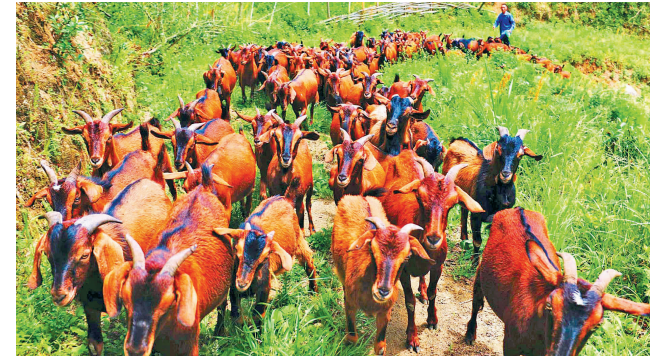
南江黄羊。