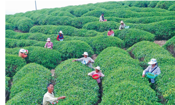
村民采茶。