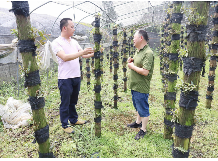
绵阳市市场监管局驻白沙村第一书记了解石斛生长情况

在此基础上，围绕“集体经济怎么办”开办专题培训班。同时，积极组织村“两委”成员到周边县(市、区)先进村学习“取经”，逐步建设起以年轻化、知识化人才为主体的复合型村干部队伍，进一步提高村“两委”成员服务集体经济的能力。