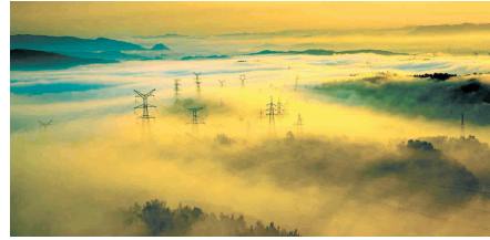
苍茫云海间