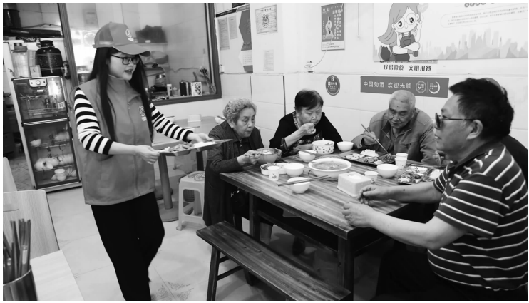
老人在“老龄食堂”开心就餐