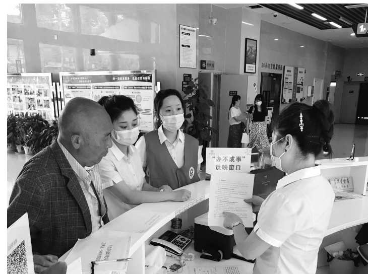
在“办不成事”反映窗口前，市民正在询问相关诉求。

本报讯 近日，眉山市丹棱县市民服务中心设立了“办不成事”反映窗口，找准群众“办不成事”症结，结合党史学习教育深化政务服务改革，以行之有效的的方式开展便民利民办实事活动。