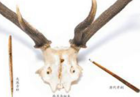
大溪文化骨针 现代骨针

草创社会的先民用竹制牙签,对现代牙签的发明,他们就用竹制牙签制成牙签,用竹制牙签,以博取奇效。