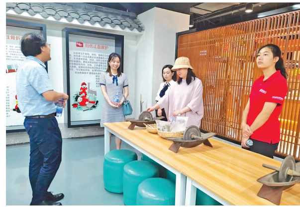
游客学习中药炮制技艺。

值得一提的是,2016年11月30日,联合国教科文组织保护非物质文化遗产政府间委员会第十一届会议通过审议,批准中国申报的“二十四节气——中国人通过观察太阳周年运动而形成的时间知识体系及其实践”列入联合国教科文组织人类非物质文化