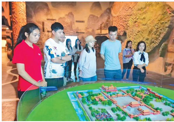
游客参观古代建筑模型。

探访期间,探班员对中国民俗文化产生了更加浓厚的兴趣。民俗,是人们在长期生活中形成的一种文化现象。中国民俗文化源远流长,内涵丰富,涵盖人们生活的方方面面,从饮食起居到岁时节令,从婚丧嫁娶到宗教信仰,都包含着深厚的文化底蕴。例如,春节是中国最重要的传统节日之一,它象征着团圆、平安和希望,人们会通过吃年夜饭、贴春联、放鞭炮等方