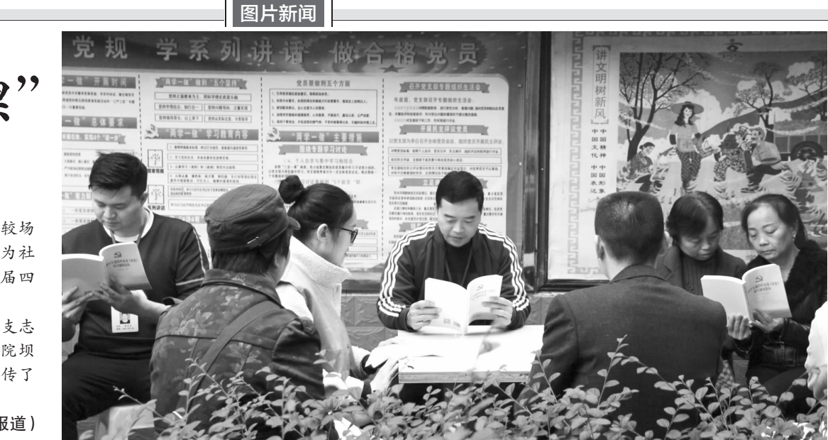
关于成都市建设大数据开放共享平台的分析与建议