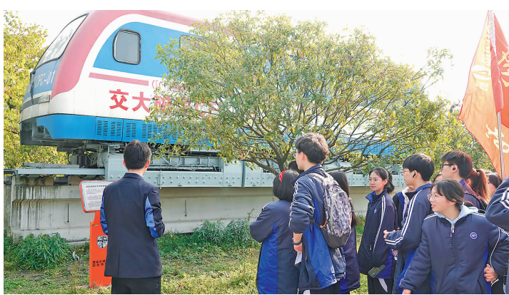
学生参观早期磁浮列车

本报讯 为激发学生奋战高考的斗志,近日,成都市郫都区第二中学组织600余名高三学子到西南交通大学参加百日冲刺誓师大会。