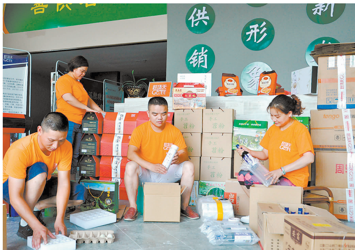
纳溪区电商中心工作人员正打包准备发往外地的“纳溪产”土特产

近年来,纳溪区按照“政府推动、商务主管、供销社主抓、部门配合、企业主体、市场运作”发展模式,“六统一”建设标准,建立了以纳溪特产电商中心为核心的区、镇、村三级电商综合便民服务网络,制