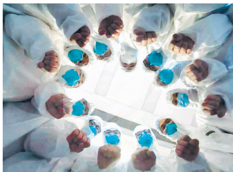
医护人员相互加油鼓劲