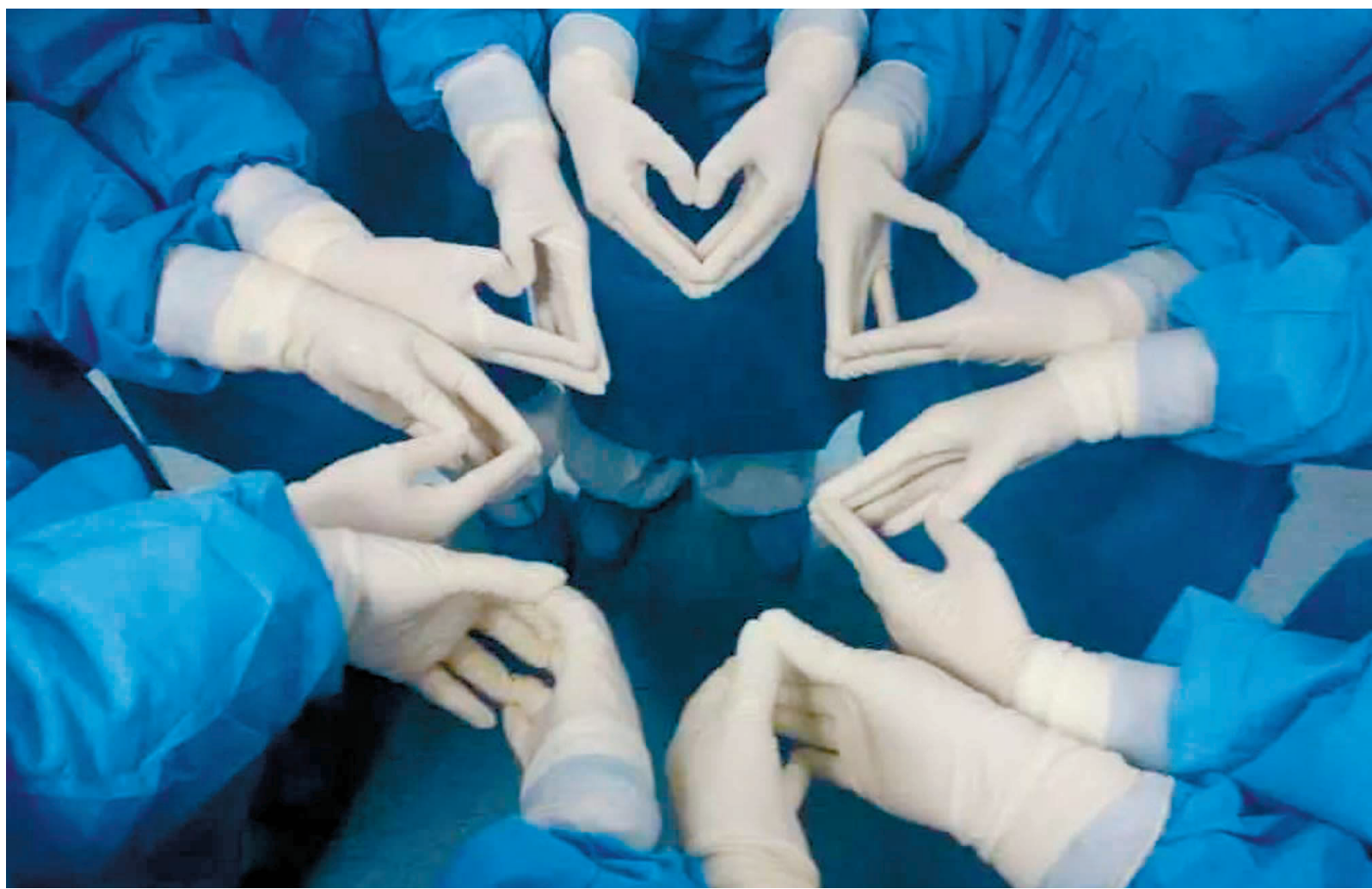
四川省第二中医医院医护人员“比心”