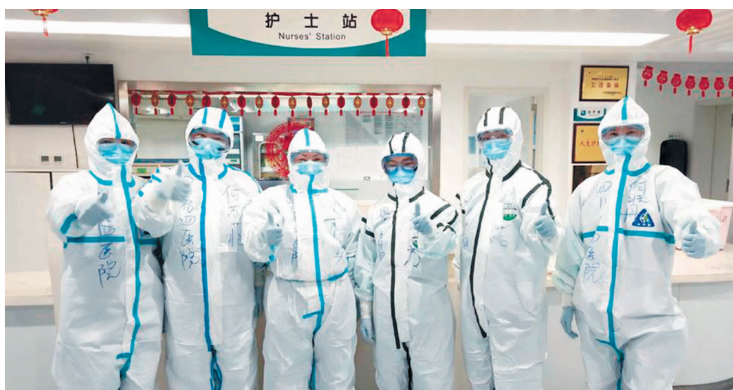
四川省第四人民医院援鄂医疗队部分队员在武汉协和医院肿瘤中心合影

与亲人告别,与同事并肩,与病魔斗争。他们,舍小家,为大家。研究治疗方案、照顾患者,白天黑夜连轴转。他们,不战胜疫情不轻言还乡。疫情就是命令,防控就是责任。在这场阻击新型冠状病毒感染肺炎疫情的斗争中,奋战在一线的白衣天使们挺身而出、英勇奋斗,为国为民安铸起一道道“生命防线”,他们的言行让无数人泪目。斗疫魔,上战场。望保重,安返乡。向逆行的白衣天使致敬,向所有坚守岗位的医务工作者致敬!