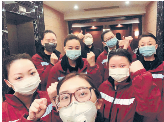
四川省骨科医院援鄂医疗队岗前培训合影