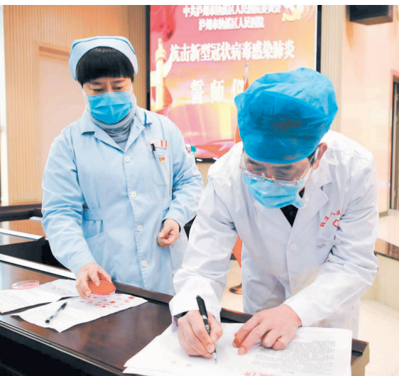
泸州市纳溪区人民医院医务工作者签下请战书