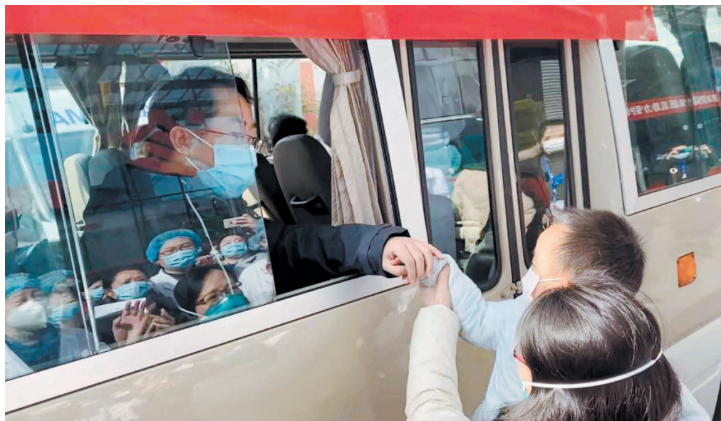
成都市第二人民医院医疗队员出征