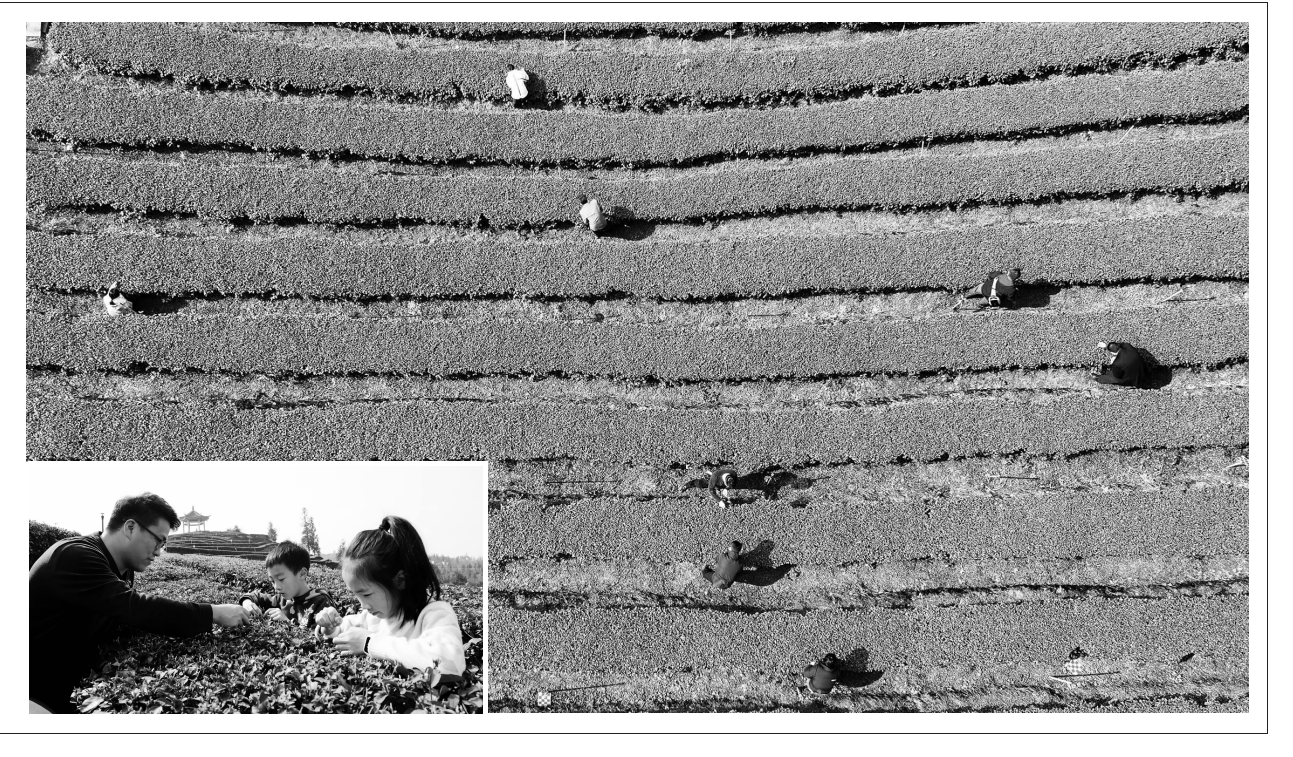
图片新闻 TU PIAN XIN WEN 春茶采摘正当时 2月19日,是二十四节气雨水,泸州市纳溪区护国镇梅岭村特早茶基地,茶农们正在采摘春茶。 近年来,纳溪区按照基地规模化、生产标准化、产品品牌化发展思路,大力推进茶产业发展和精深加工,带动茶农致富,让周边村社群众就近就业增收。