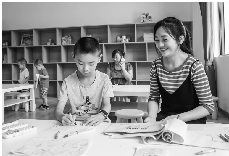
居民正在“天府之家”画画

近日,笔者走进成都市新津区普兴街道岳店社区,一眼望去,花团锦簇、绿树成荫,一排排整齐排列的花园小区坐落其中,构成了人与自然和谐共生的美景。休闲广场上,社区阿姨们跟随着音乐的律动,迈着轻快的步伐,跳着当下流行的健身舞;“天府之家”文化活动中,不少社区居民读书、下着棋、看着电影……静静享受着属于自己的闲暇时光。