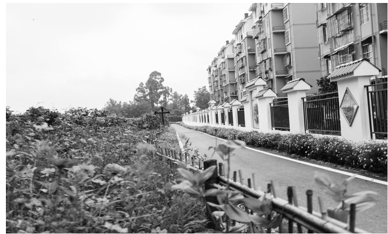
社区新建的休闲绿道

活动中心和休闲广场,聊天、下棋、跳广场舞……大家一边玩一边笑,日子过得幸福又美好。不少居民还根据自己的兴趣爱好,和志同道合的居民们组建起一支支自组织队伍,平日里自行开展活动,丰富精神文化生活。