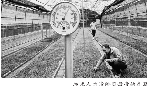
技术人员清除贝母旁的杂草