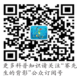
更多科普知识请关注“赛先生的背影”公众订阅号