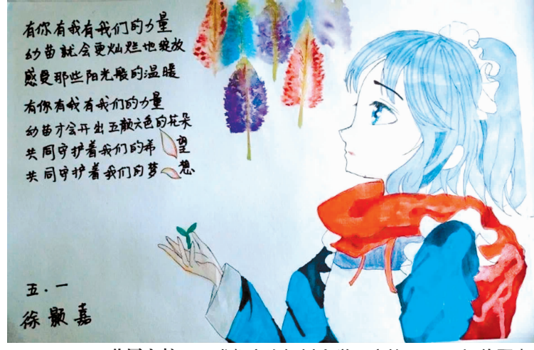
共同守护 成都市泡桐树小学天府校区五一班 徐颖嘉