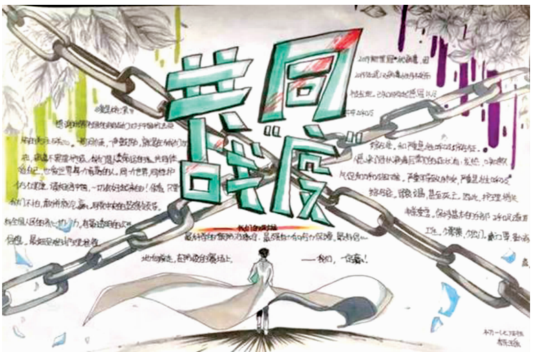
共同战“疫” 四川师大附中初一7班 李乐瑶