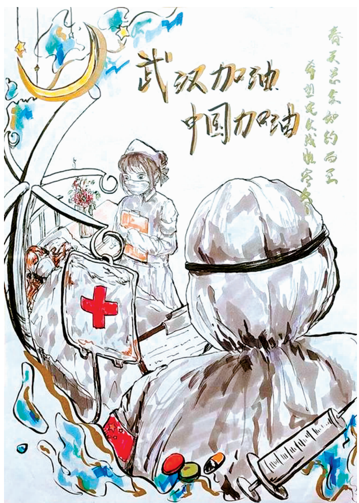
武汉加油!中国加油! 四川师大附中初一5班 吴侯俊