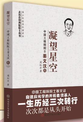
凝望星空——中国工程院院士姜文汉传

两院院士是国家设立的最高学术称号，也是我国科技人才队伍的杰出代表。两院院士是国家的财富、人民的骄傲、民族的光荣，他们为祖国和人民作出了彪炳史册的重大贡献。