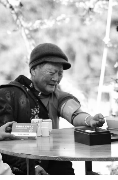
飞仙关社区“微型科普馆”