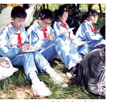
学生制作观鸟笔记