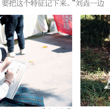
学生制作观鸟笔记