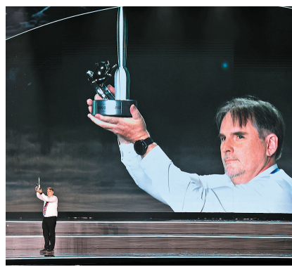
雨果奖奖杯底座揭晓。