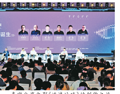
嘉宾分享电影《流浪地球》的创作之旅。

切实推动科幻产业落地,四川科幻世界杂志社有限公司还将与中国航空学会、成都影视城等进行战略合作,共同打造航空类科幻IP品牌,推动优质科幻IP的影视转化,加速优质科幻产业资源落户四川。签约现场,两部科幻网剧《武侯成时一更》《寻找会说话的猫》也宣布落地四川。