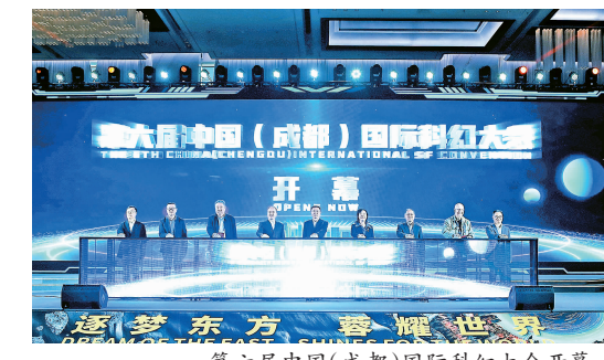
第六届中国(成都)国际科幻大会开幕。

开场伊始,来自成都市锦官新城小学的绿鸽合唱团带来了一首童声合唱《期待的远方》。作为“中国科幻之都”成都的未来之星,他们用歌声表达出对全球科幻大咖的欢迎。