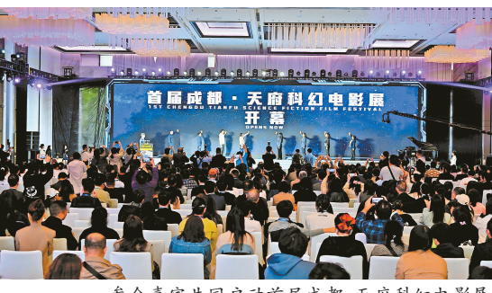
参会嘉宾共同启动首届成都·天府科幻电影展。

据了解,活动组委会将对遴选出的部分优秀科幻画和科幻文学类作品,汇编成《点燃想象火花:首届四川省青少年科幻创作征集活动优秀作品精选集》,由四川省科学技术出版社