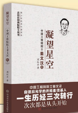
凝望星空——中国工程院院士姜文汉传

两院院士是国家设立的最高学术称号,也是我国科技人才队伍的杰出代表。两院院士是国家的财富、人民的骄傲、民族的光荣,他们为祖国和人民作出了彪炳史册的重大贡献。