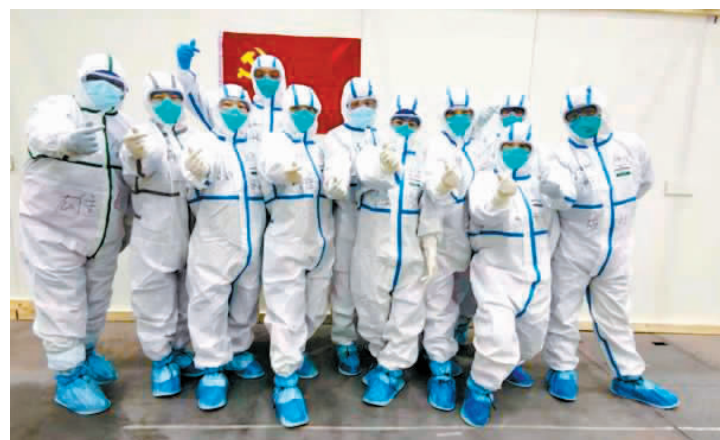
救援队部分成员合影